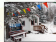
26 novembre 2010