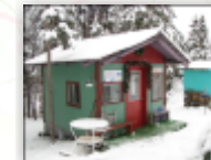
2 décembre 2010